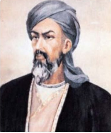
İbn-i Sina (980-1037) (temsilî)